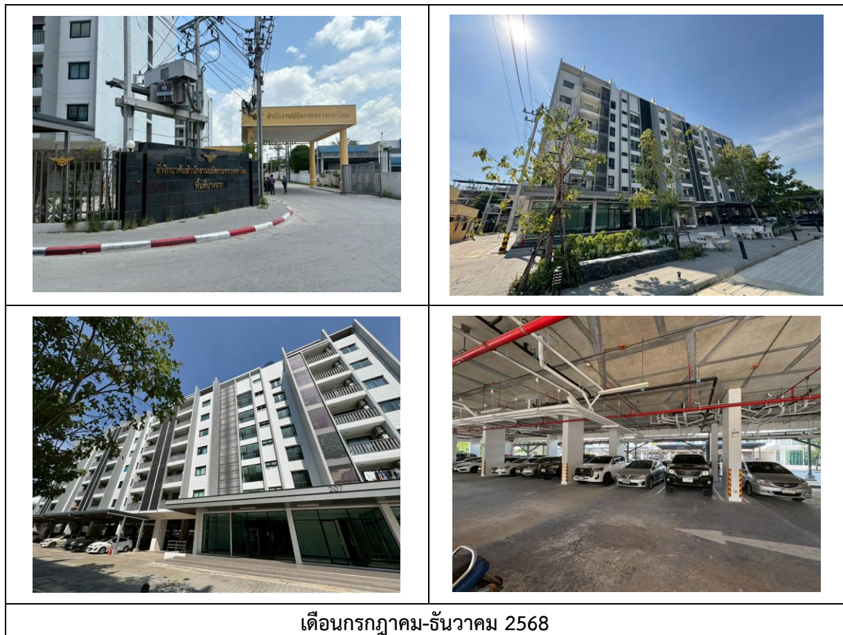
รูปที่ 1.3-1 สภาพปัจจุบันของโครงการ